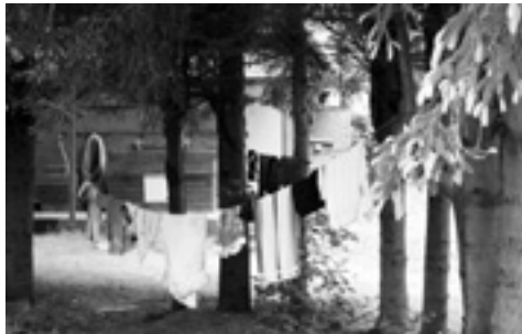
Unsere Wäscheleine mit den nassen Sachen

Danach setzen wir uns in die Autos und fahren nach Hause. So ging die Pfingstfahrt schnell zu Ende.