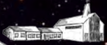
Heilig Herz Jesu Tostedt