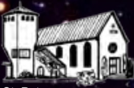
St. Petrus Buchholz